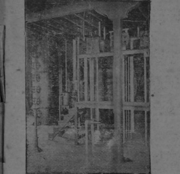
Tercer piso del nuevo edificio, donde se ejerce el manejo y control del aparato.

Los productos de la Fábrica Nacional de Licores premiados con medalla de oro, en la Exposición que se clausuró el domingo, lo que significa un nuevo triunfo para esta importante dependencia de la Administración Nacional y después de una labor de muchísimos años, ha logrado perfeccionar sus artículos, especialmente en el carácter recto, ajeno a las pasiones mesquinas; sabe siempre hacerse querer de quienes le rodean y tanto en lo social como en lo político, es una figura a la que se eleva sobre sílo pedestal, formado con sus propios actos y personales merecimientos.