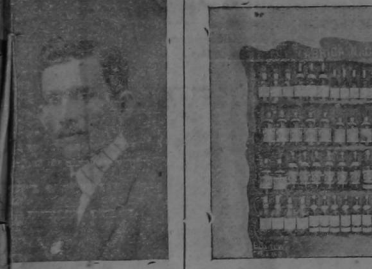
La estantería para envases que contienen los productos de la Fábrica que se exhibían en la Exposición Nacional.

LA FABRICA NACIONAL Durante la administración del señor Escalante, se han llevado a cabo grandes e importantes mejoras en la Fábrica Nacional, que si han costado bastante, en cambio produce sobradamente al interés del capital invertido. Entre estas reformas se encuentran la instalación del nuevo alambique, diseñado y calculado para las exigencias y condiciones del trabajo de esta fábrica, por el ingeniero don Francisco Tristán y construido en los Estados Unidos por la acreditada casa "The Babcock Iron Works Company"; al llegar este alambique a la Fábrica, fué armado por el competente mecánico don Ricardo Rodríguez.